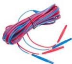
Cable de dos hilos (10 / 25 A) U1/ I1 6 m / 10 m / 15 m

WAPRZ006DZBBU111 WAPRZ010DZBBU111 WAPRZ015DZBBU111