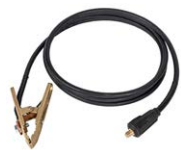
Cable de prueba de corriente 3 m, negro I2 (200 A, 25 mm 2 )