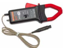
Pinza de medición C-5A (fi 39mm) 1000 A AC/DC