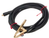
Cable de prueba de corriente 6 m / 10 m / 15 m negro I2 (200 A, 25 mm 2 )

WAPRZ006BUBBU1 WAPRZ010BUBBU1 WAPRZ015BUBBU1