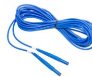
Cable 6 m / 10 m / 15 m azul 1 kV U1 (conectores tipo banana)

WAPRZ006DZBBU111 WAPRZ010DZBBU111 WAPRZ015DZBBU111