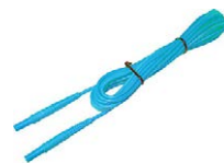
Cable 3 m azul 1 kV U1 (conectores tipo banana)