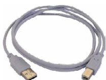
Cable de transmisión de datos micro USB