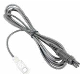
Sonda para medir la temperatura ST-3