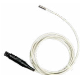
Sonda para medir la temperatura ST-1

WAPRZ006BUBBU2 WAPRZ010BUBBU2 WAPRZ015BUBBU2