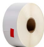
Pegatina - cinta de papel para la impresora D2 SATO