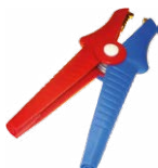
2x cocodrilo Kelvin 1 kV 25 A